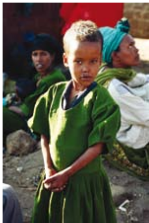
Уличный мальчик в Агус-Абебе

По данным отчета 1 Целей Развития Тысячелетия за 2007 год, за последние пятнадцать лет наблюдается ликвидация бедности в абсолютном и относительном смыслах “Доля населения, живущего в условиях крайней нищеты, сократилась с трети, до одной пятой населения в период между 1990 и 2004”. Хотя, несомненно, то, чем мы гордимся, произошло в основном из-за большого и быстрого экономического роста в странах Восточной и Юго-Восточной Азии, что привело к значительному сокращению бедности. Ситуация не совсем благоприятная, как в Западной Азии так и в Африке, к югу от Сахары. Несмотря на улучшение ситуации в последние годы, доля людей, живущих на один доллар в день, остается очень высокой в Африке, к югу от Сахары (41,1%) и в Южной Азии (29,5%). Кроме того, в то время как число крайне бедных людей сократилось, неравенство доходов увеличилось практически в каждом регионе, что в дальнейшем приведет к напряженным отношениям в обществе. Должны быть разработаны конкретные стратегии таким образом, чтобы заострить внимание на самых бедных слоях населения.