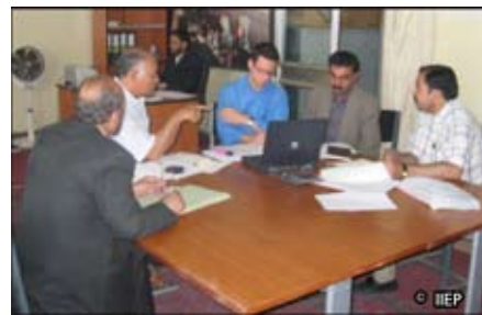
Процесс стратегического планирования в действии в Министерстве Образования Афганистана

В течение продолжающегося стратегического процесса планирования в Афганистане, партнеры рассмотрят возможности МОИ по поддержке и развитию управленческих возможностей Отдела Планирования