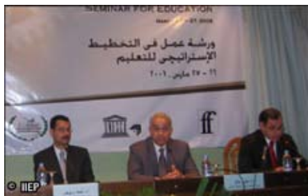
Семинар стратегического планирования образования, Каир, Египет, 6-7 марта 2006

М ИНИСТЕРСТВО Образования Египта (МО) и Министерство Высшего образования (МВО), вместе с МИПО и ЮНЕСКО, провели ряд исследований и мероприятий с целью систематизировать стратегические усилия по планированию в рамках обоих министерств. Эти исследования показали, что есть потребность в выработке общей концепции стратегического планирования и разработке соответствующих организационных структур, процессов и технических навыков на национальном уровне и на уровне организаций.