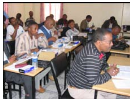
Учебная сессия МИПО в Авассе, Эфиопия, в 2006 году

Контекстный анализ, предпринятый в течение двухнедельной миссии МИПО, помог определить характеристики программы развития способностей. Программа сосредотачивается на группах, а не на отдельных личностях. В каждом курсе, каждая область представлена несколькими людьми, которые сотрудничают в сфере планирования образования. Обучение также близко связано с задачами сотрудников: это – поддержка работы, а не дополнительное задание, которое должно быть выполнено. В процессе обучения принимается во внимание даты ожидаемых результатов и инфраструктура, доступная для выполнения задачи. Курсы выглядят как элементы коллегиального взаимодействия, и они усиливают сотрудничество между областями и с федеральным Министерством, сотрудники которого также учас-