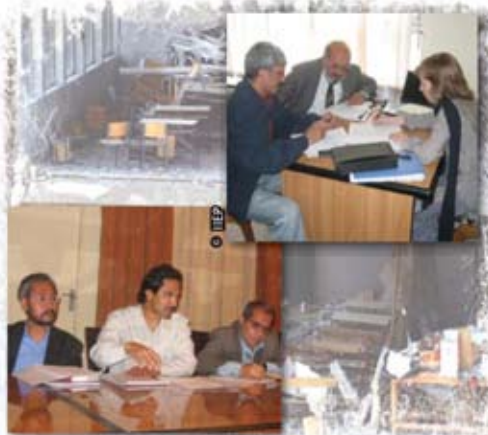
Восстановление образования в Афганистане

Необходимо, в конце концов, проанализировать ведет ли такой альтернативный подход к желательному результату. Имеются очевидные факты, указывающие на существенное движение в этом направлении, как отмечается в многочисленных проектах и работах, осуществляемых МИПО. Один из примеров демонстрирует прогресс, достигнутый в Юго-Восточном Африканском Консоциуме по Контролю Качества Образования (SACMEQ), когда Институт смог передать управление директору, находящемуся в Зимбабве. И все же эффективная реализация подобного подхода требует длительных усилий в течение долгого времени при участии одних и тех же партнеров, с тем чтобы дать возможность им стать независимыми от поддержки МИПО. Сколько времени это потребует, зависит от конкретной страны и главным образом зависит от подготовки сотрудников в министерствах образования, от соответствия их квалификации выполняемой ими работе и от их желания совершенствовать свои навыки и знания. Это, в свою очередь, определяется политической стабильностью в стране, достигнутого уровня высшего образования и подготовки, и систем, имеющихся на местах и обеспечивающих набор и прием на работу, а также сохранение и стимулирование квалифицированных кадров.